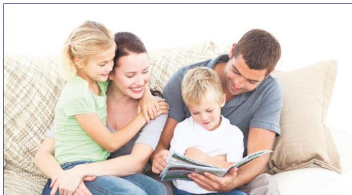
Lesespaß für die ganze Familie!

Das Kälteschutzquartier schließt eine Lücke für freiwillig wohnungslose Menschen in Kehl. Bevor die Unterkünfte existierten, mussten Obdachlose für eine warme Unterkunft entweder nach Offenburg oder Straßburg. In der vergangenen Kälteschutzsaison ist sowohl die Zahl der Übernachtungen (912) als auch die Zahl der Gesamtnutzerinnen und -nutzer (36) im Vergleich zum Vorjahr angestiegen. Algeco stellt neben den Containern zusätzlich die Betten, Matratzen und sowie die Toiletten zur Verfügung. Auch sozialverträgliche Hunde dürfen mit übernachten. Geöffnet werden die Container ab 14 Uhr. Werktags müssen die Übernachtungsgäste ihre Unterkunft zwischen 8 und 9 Uhr sauber verlassen. An Wochenenden und Feiertagen steht das Kälteschutzquartier den ganzen Tag über offen.