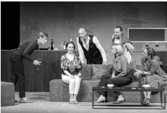
Das a.gon Theater aus München inszeniert das schon als Film weltweit erfolgreiche Schauspiel „Das perfekte Geheimnis“

Karten gibt es im Vorverkauf bei der Tourist-Information unter 07851 88-1555, bei allen Reservix-Vorverkaufsstellen sowie auf www.kultur.kehl.de .