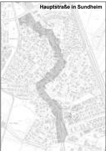
Hauptstraße in Sundheim