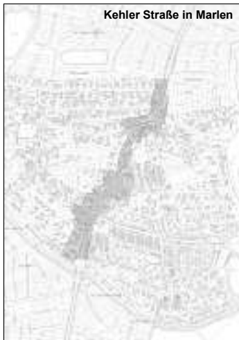
Kehler Straße in Marlen