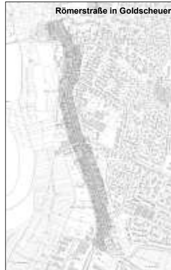
Römerstraße in Goldscheuer