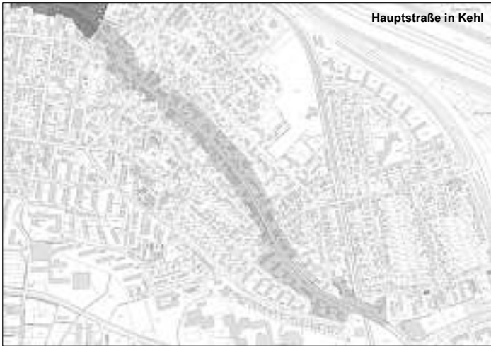
Hauptstraße in Kehl