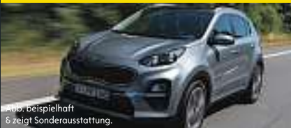
Abb. beispielhaft & zeigt Sonderausstattung.

Benzin, 130KW (177 PS), Schaltgetriebe, Frontantrieb