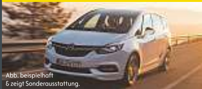
Abb. beispielhaft & zeigt Sonderausstattung.

Benzin, 125KW (170 PS), Schaltgetriebe, Frontantrieb