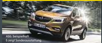
Abb. beispielhaft & zeigt Sonderausstattung.

Benzin, 103 KW (140PS), Schaltgetriebe, Frontantrieb