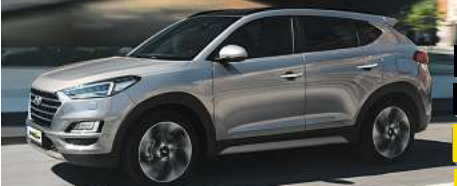
Abb. beispielhaft & zeigt Sonderausstattung.