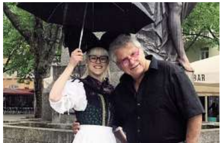
Foto: Leonie Kruss und ich werden Sie am Hanauer Owe nicht im Regen stehen lassen ...

Wir suchen für unsere Tierheimleiterin mit ihren zwei Hunden eine schöne