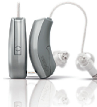
Widex Dream440, Abbildung in Originalgröße