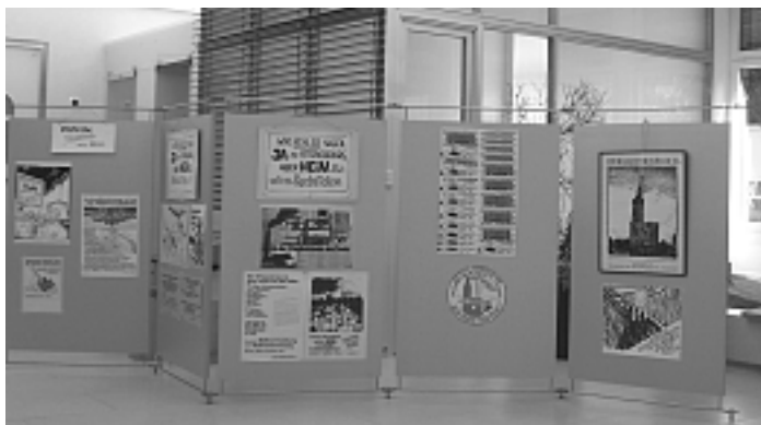
Plakate, Flugblätter, Karikaturen aus der Anfangszeit der heutigen BI Umweltschutz Kehl.