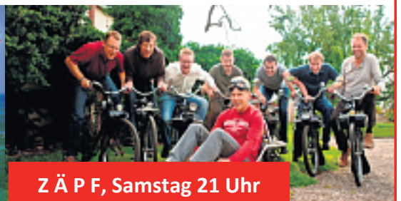
Z Ä P F, Samstag 21 Uhr