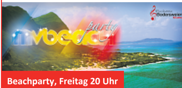
Beachparty, Freitag 20 Uhr