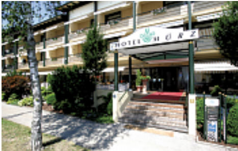
Haupteingang des Boutique & Feelness Hotel Mürz