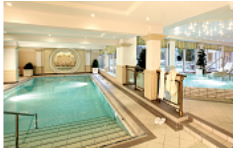
Loslassen und entspannen

Jeden Monat Gewinnchance auf einen Urlaub zu zweit!