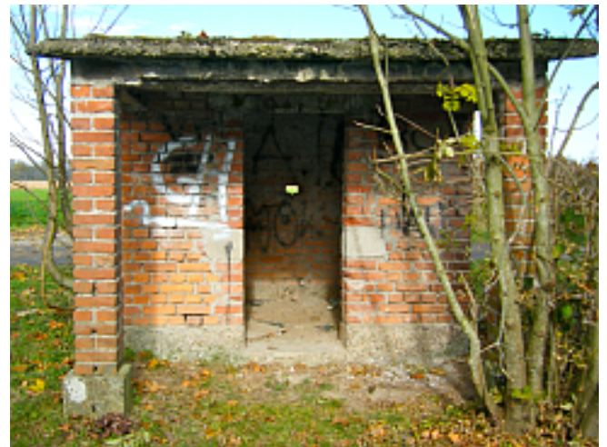
Vor und nach der Restaurierung.

So steht das „Sauhiesel“ nun wieder in neuem, bescheidenem Glanz am Eingang zur Kleingartenanlage, die einmal Sauweide war, und wird hoffentlich noch lange an eine vergangene bäuerliche Kulturperiode erinnern.