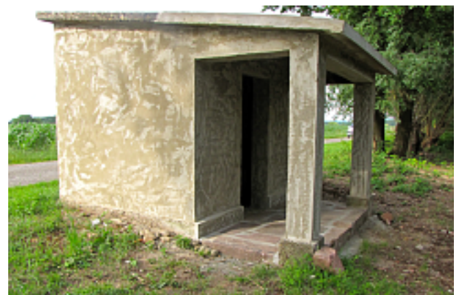
Text und Fotos: Karl Britz, Manfred Kropp