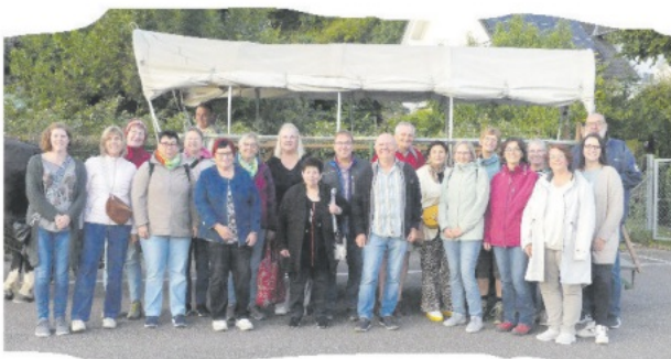
Die Sängerinnen und Sänger des Chores De R(h)ein - Voices e.V. Bodersweier

Wir waren dabei. Vielen Dank für Ihr Interesse.